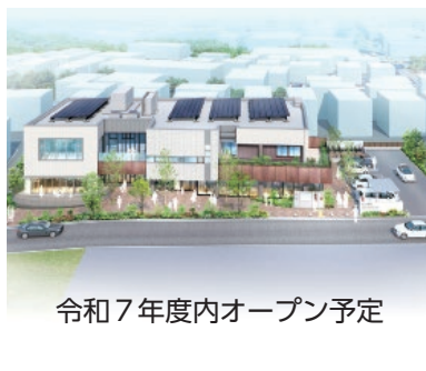
令和7年度内オープン予定