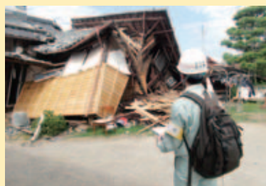
家屋の被害状況を調査する市職員

市は、熊本地震の復興を支援するため、4月25日～5月20日にかけて熊本県熊本市と上益城郡益城町に計6名の市職員を派遣しました。派遣された市職員は、被災した建物の応急危険度の判定や、り災証明発行に必要な被害認定調査などに従事しました。