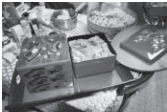
はつまつ初午の料理

生活と自然環境、村のつきあい、農業、仕事、都市化、神社、寺院、年中行事、職人、衣食住、人の一生、冠婚葬祭、民俗芸能、獅子舞、お囃子など