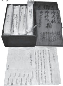
江戸時代の古文書

江戸時代の古文書はもちろん、明治から平成に至るまでのさまざまな古文書や書類が調査・収集対象です。個人や家、団体、地域についての歴史調査の積み重ねが「市史」を形づくりま