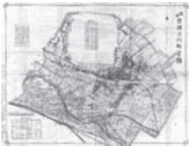
立川町全図(昭和5年)