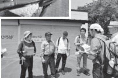
聞き取り調査の様子