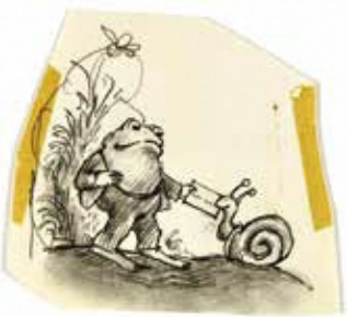
『ふたりはともだち』(1970) 「おてがみ」スケッチ ©Arnold Lobel. Used by permission of HarperCollins Publishers.

PLAY! MUSEUMで開催中のアーノルド・ローベル展。小学校の国語教科書でもおなじみ「がまくんとかえるくん」の作者のローベルは、絵本を3色刷りで作っていました。当時の絵本作りを学びながら、1色の印刷体験を楽しむことができます。本講座は、市とPLAY! の相互協力に関する協定に基づき開催します。申込方法等、くわしくは市ホームページをご覧ください。📍市内在住・在学の方(小学生以下は保護者同伴)時3月20日(土)祝午前11時～午後3時30分(1回30分の6部制)場窓口サービスセンター多目的スペース費500円(材料代ほか)定各10人(申込順)問市産業観光課観光振興係・内線2658