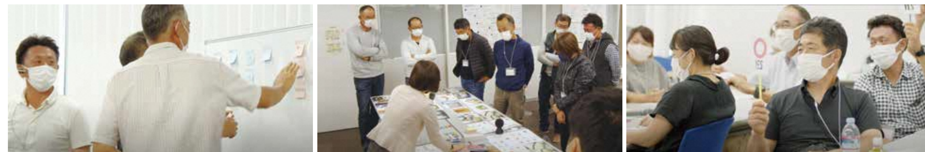
メンバー10人に市やJA東京みどりの職員も加わって、毎回白熱した議論を重ねました

「立川印」は農家さんお墨付きの証です こだわりの野菜や果実 特産品から授かるいのちの恵み 心を潤すお花や植木 未来へつなぐ農育プロジェクト この7つの宝物に「立川印」がついているはず 深呼吸したら 目で耳で鼻で口で カラダいっぱい感じるよう さあカラダとココロに ごほうびを