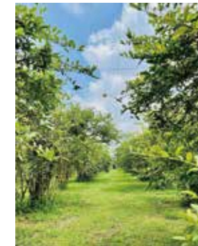
特別賞 「ブルーベリーの森」 masa.t189さん