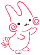
立川市公式キャラクターくるりん