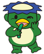
昭島市公式キャラクターちっぽー