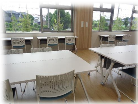
給食を食べる部屋です。

*みんなのくるりんキッチンInstagram では、毎日の給食を掲載しています。