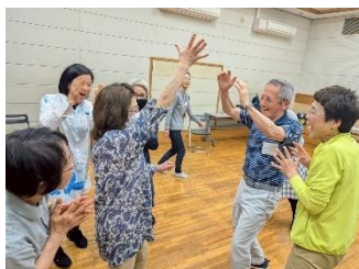
人とつながる！インプロで脳トレ&コミュニケーション