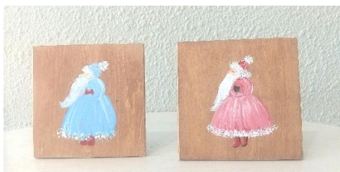
カラフルな自分だけのサンタクロースを描こう！