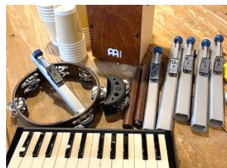
みんなで音☆リズムを楽しもう！ ～楽譜がよめなくてもだいじょうぶ！～