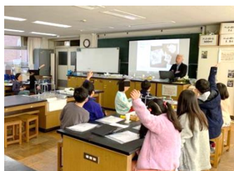
モバイル顕微鏡でミクロ世界に遊ぶ