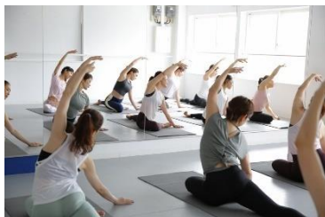
寝っ転がってできるセルフケア♡ 美しく整える美容メソッド「床バレエ」