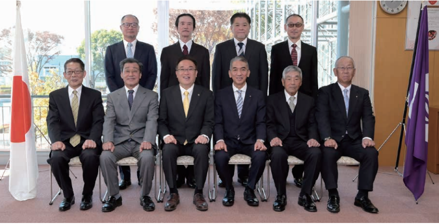
技能功労者褒賞を受けられた皆さん