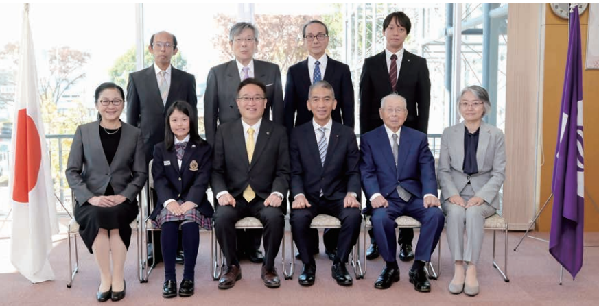
市民表彰を受けられた皆さん