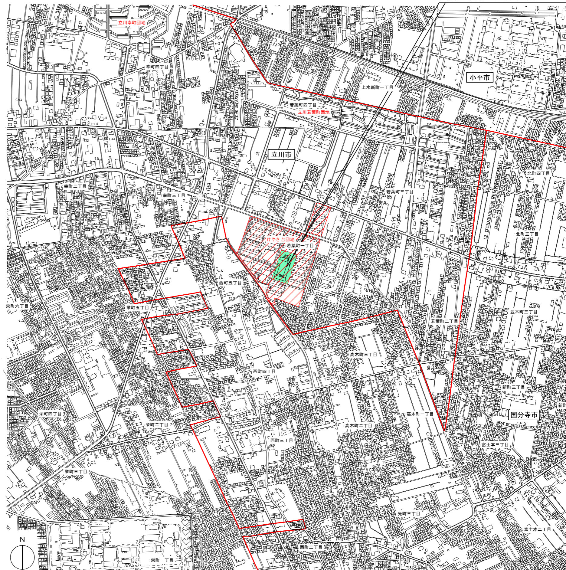
基盤地図情報（国土地理院）を加工して作成 S=1/10000