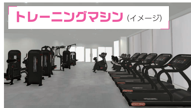
トレーニングマシン (イメージ)