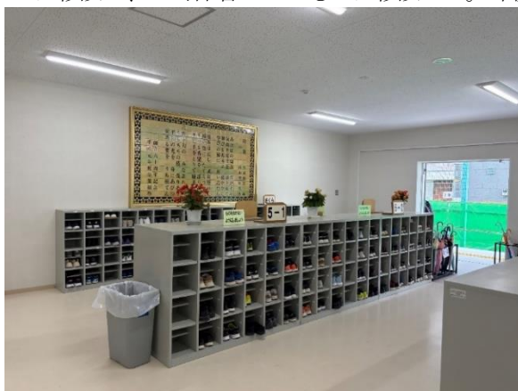
校歌銘板を仮設校舎に移設（平成元年卒業制作物）