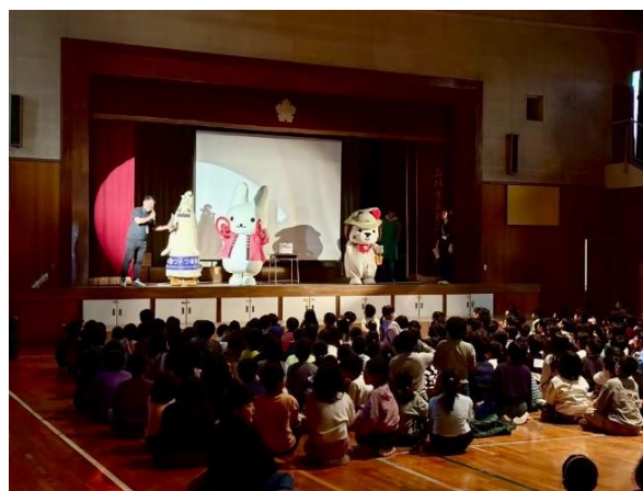
くるりん・ウドラ・トコちゃんも参加