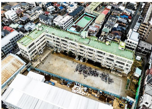
ドローンによる撮影の様子