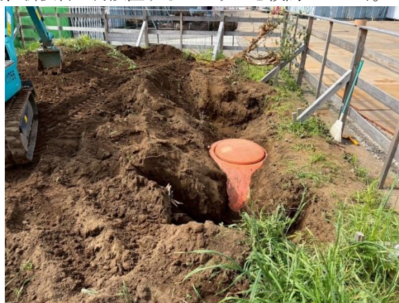
タイムカプセル掘出し（平成2年度設置）